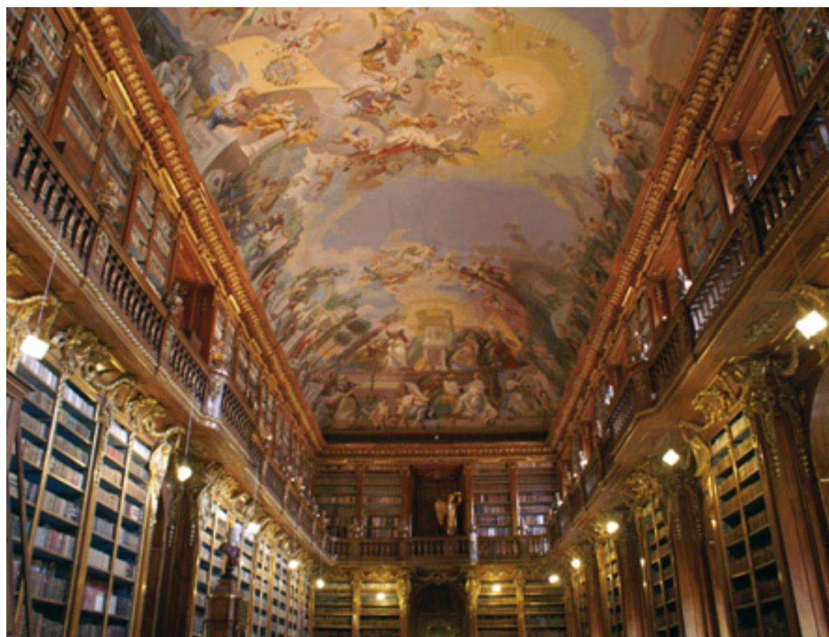
Die Bibliothek im Strahov-Kloster: Schätze aus vergangenen Zeiten zum Greifen nah.

In wenigen Minuten zu Fuß ist vom Burgtor aus das Strahov-Kloster erreicht. Hier besuchen wir das Literatur-Museum bzw. die Kloster-Bibliothek. Wir kommen aus dem Staunen nicht mehr heraus: Tausende von historischen Büchern und Schriften stehen in Meter langen und deckenhohen Holz-Regalen. Diese uralten Schätze aus längst vergangener Zeit, wunderschöne Deckenmalereien und Stuckelemente versetzen uns