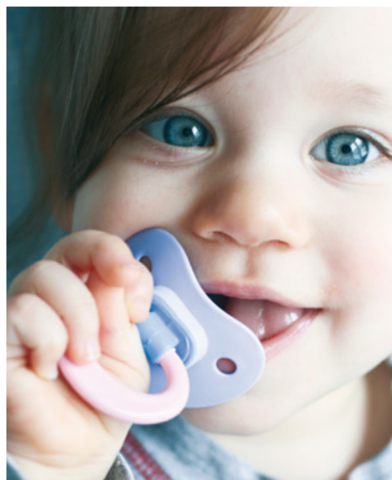
Ein Schnuller macht nicht nur das Kind glücklich... auch die Eltern haben etwas davon.