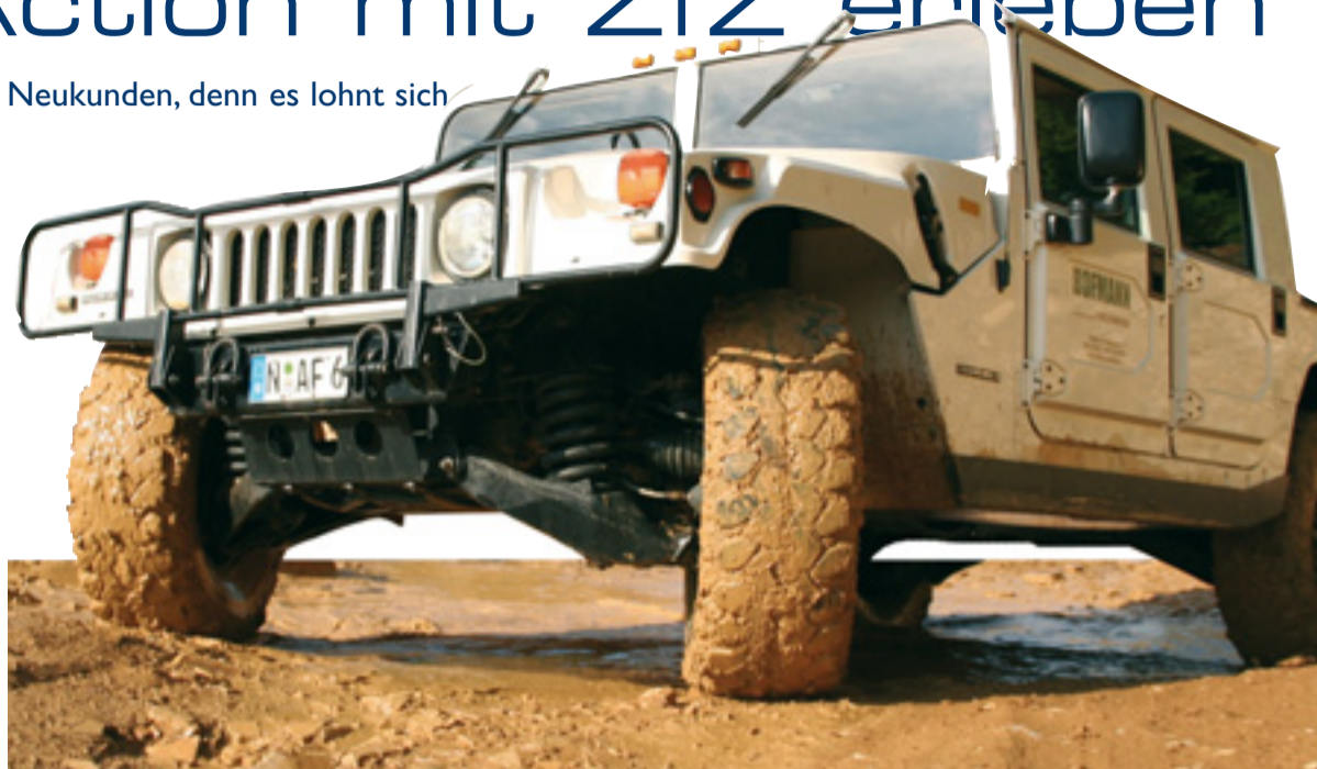
Abenteuer pur: die Fahrt mit einem Hummer.

Erleben Sie das Flair Baden-Badens. Wir schenken Ihnen zwei Übernachtungen inklusive Frühstück in einem Vier-Sterne-Hotel. Lassen Sie sich zum stilvollen Ausklang des Tages in die Säle des Casinos Baden-Baden ent-