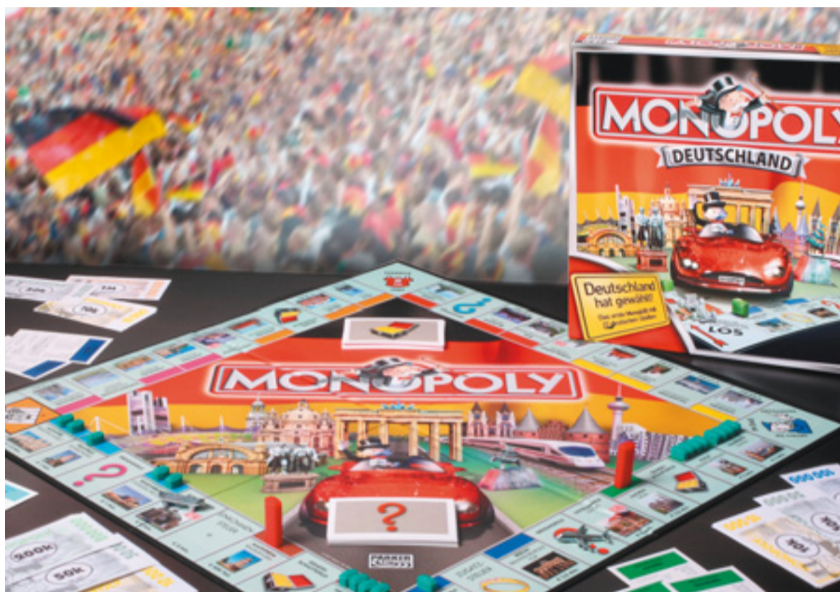
Die Frischzellenkur hat bei Monopoly einige Veränderungen gebracht.