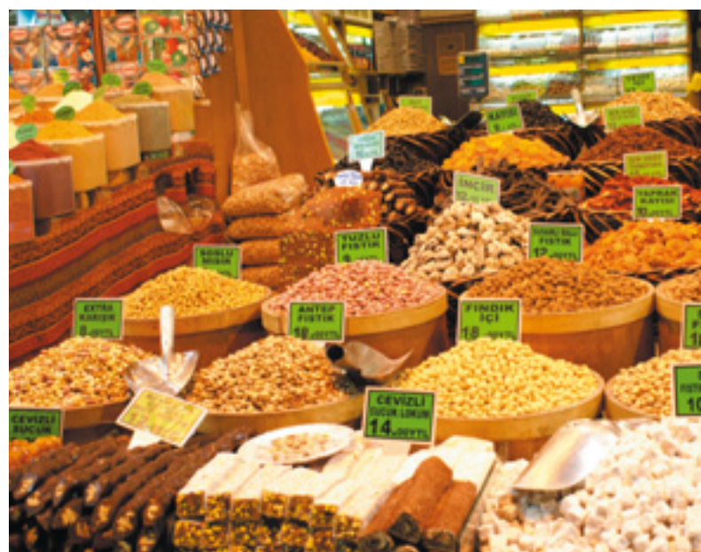
Der Große Basar in Istanbul: So muss ein türkischer Basar sein.

In Erinnerung bleibt uns Istanbul als bunte, moderne und riesige Stadt, traumhaft am Bosphorus gelegen, die ihren Besuchern viele beeindruckende geschichtsträchtige Sehenswürdigkeiten bietet. tr