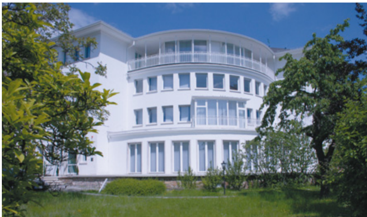
In Wiesbaden befindet sich eine der beiden Privatzahnkliniken.