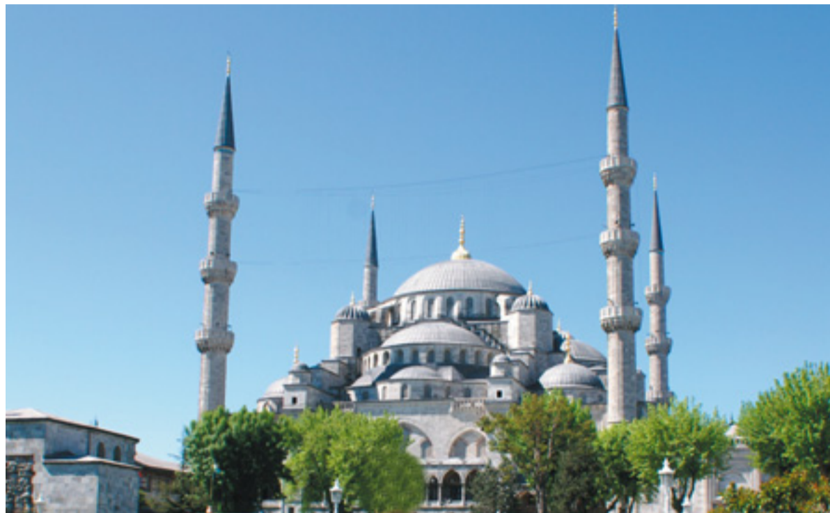
Ein Wahrzeichen Istanbuls: Die Blaue Moschee vor strahlend blauem Himmel. Auf diesem Bild sind zwei der berühmten sechs Minarette zwar nicht zu sehen, doch sie ist es wirklich.