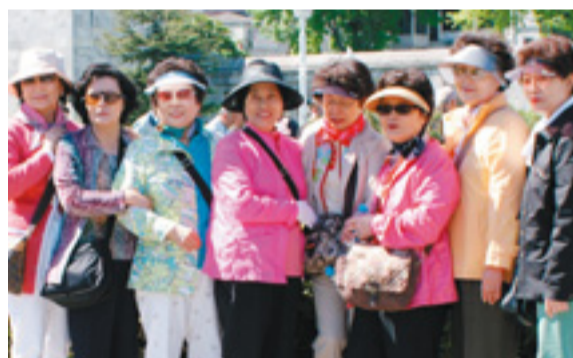
"Cheese"... Manchmal werden sogar Touristen zur Sehenswürdigkeit.

viele Reichtümer hinter sicherem Glas für die Besucher ausgestellt. Bunt und lebhaft geht es auf den